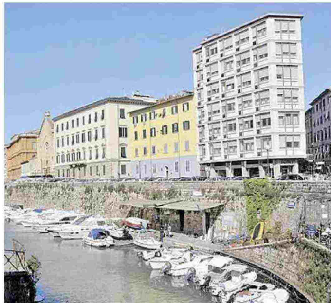
LE ZONE A sinistra i palazzi di prestigio sul Viale Italia e a destra alcuni immobili sugli scali nella parte storica della città